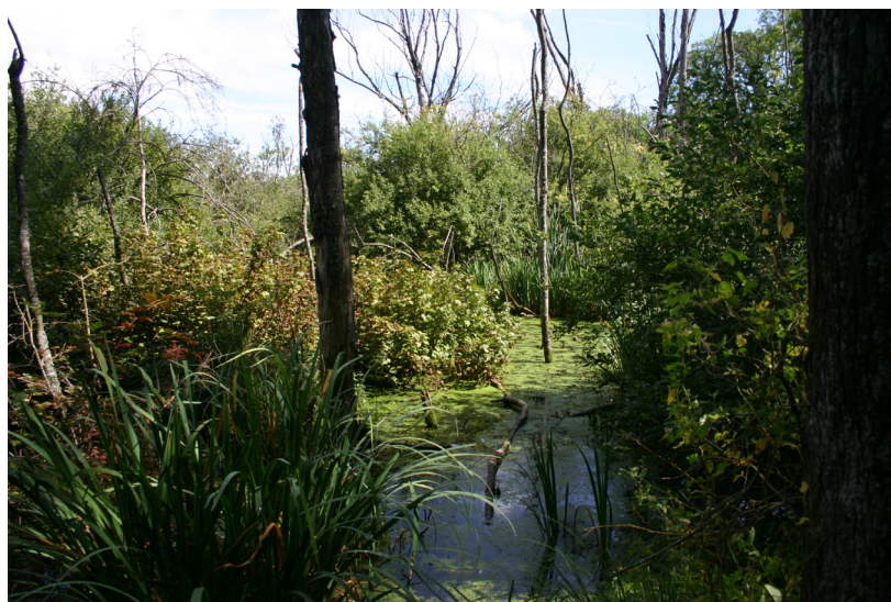
Le marais est recouvert de lentilles d'eau et abrite Riccia fluitans , une espèce possédant le statut vulnérable en Suisse.