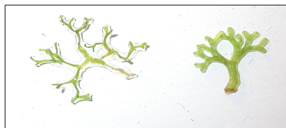
Riccia fluitans (forme aquatique à gauche et terrestre à droite); voir sa fiche d'espèce.